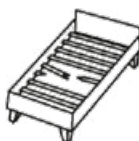
Bettgestell 3-4 Marken