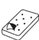
Matratze 2-3 Marken

Musterbeispiele für die korrekte Handhabung der Sperrgutmarken der Gemeinde Boppelsen: